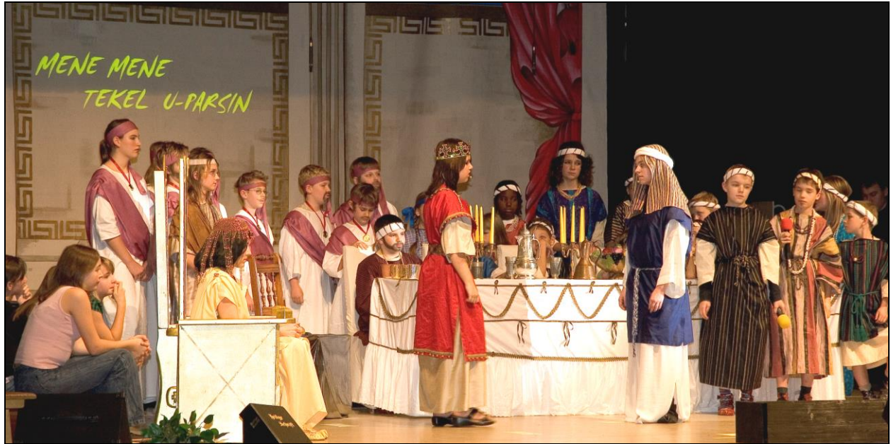
Musical-Projekt 2006 »Die Schrift an der Wand«

und 180 Glaubensgeschwister engagiert mitgewirkt. Dies hat sich bezirksintern sehr positiv ausgewirkt, aber auch extern viel Beachtung gefunden.