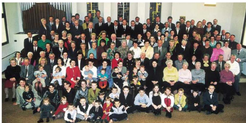
◁ Die Geschwister aus Horrheim, der ältesten Gemeinde im Bezirk Bietigheim-Bissingen

Den Platz als zweitälteste belegte mit im-