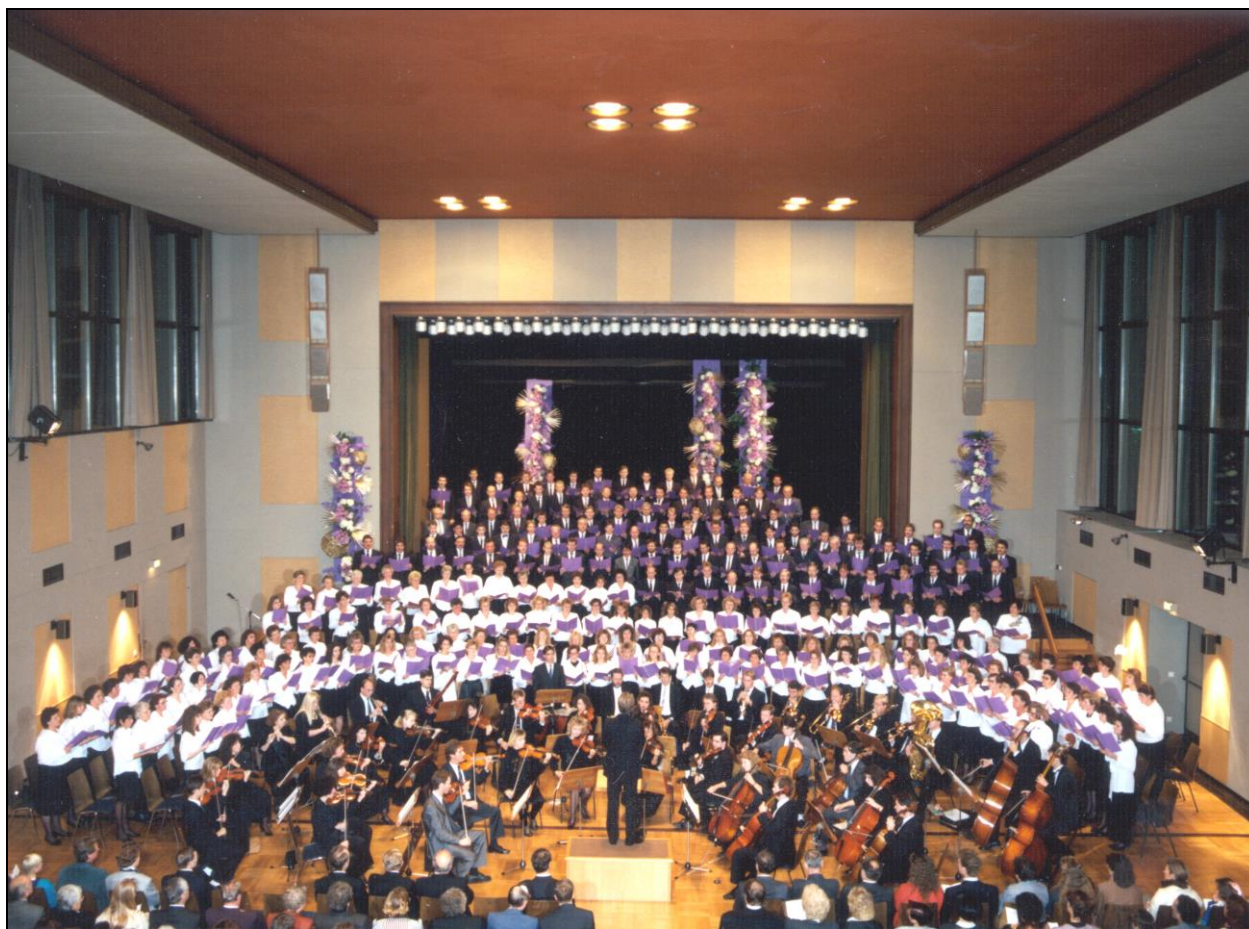
Konzert in der Stadthalle Vaihingen an der Enz im Oktober 1991

1970 fand im Bezirk Bietigheim-Bissingen erstmals ein Singen und Musizieren für Gäste statt. Die musikalischen Darbietungen erfolgten durch den Jugendchor und das Jugendorchester des Bezirks. Bei vielen Öffentlichkeitsveranstaltungen wurden in der Folgezeit Gemeinde- oder Bezirksklangkörper eingesetzt. Auch Vorträge in Krankenhäusern und Seniorenheimen haben Tradition und werden regelmäßig gepflegt.