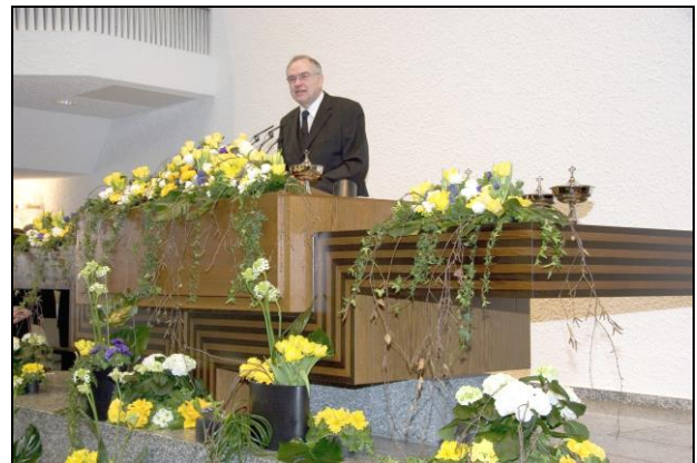
Bezirk Bietigheim-Bissingen beim Stammapostel-Gottesdienst am 4. Februar 2007 in der Kirche Fellbach