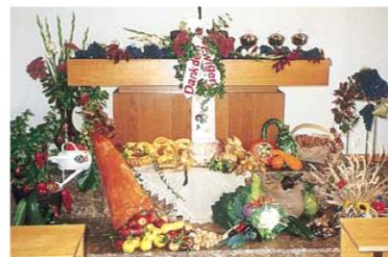
Altar am Erntedanktag; Einstimmung zum 75. Geburtstag der Gemeinde Bissingen

Bericht in der Kirchenzeitschrift „Unsere Familie“ vom 20. Mai 2001