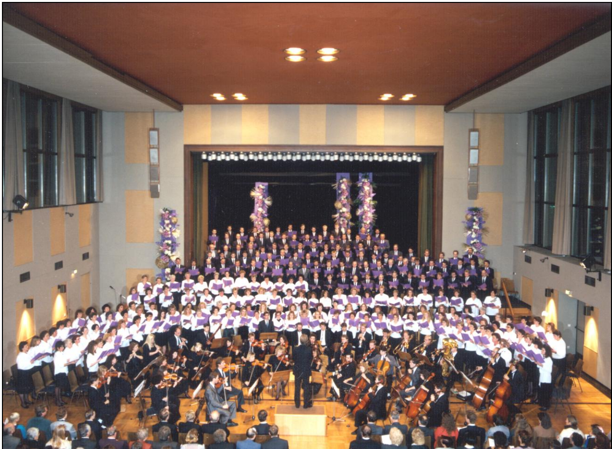
Konzert in der Stadthalle Vaihingen an der Enz im Oktober 1991

1970 fand im Bezirk Bietigheim-Bissingen erstmals ein Singen und Musizieren für Gäste statt. Die musikalischen Darbietungen erfolgten durch den Jugendchor und das Jugendorchester des Bezirks. Bei vielen Öffentlichkeitsveranstaltungen wurden in der Folgezeit Gemeinde- oder Bezirksklangkörper eingesetzt. Auch Vorträge in Krankenhäusern und Seniorenheimen haben Tradition und werden regelmäßig gepflegt.