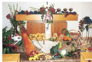
Altar am Erntedanktag; Einstimmung zum 75. Geburtstag der Gemeinde Bissingen

Bericht in der Kirchenzeitschrift „Unsere Familie“ vom 20. Mai 2001