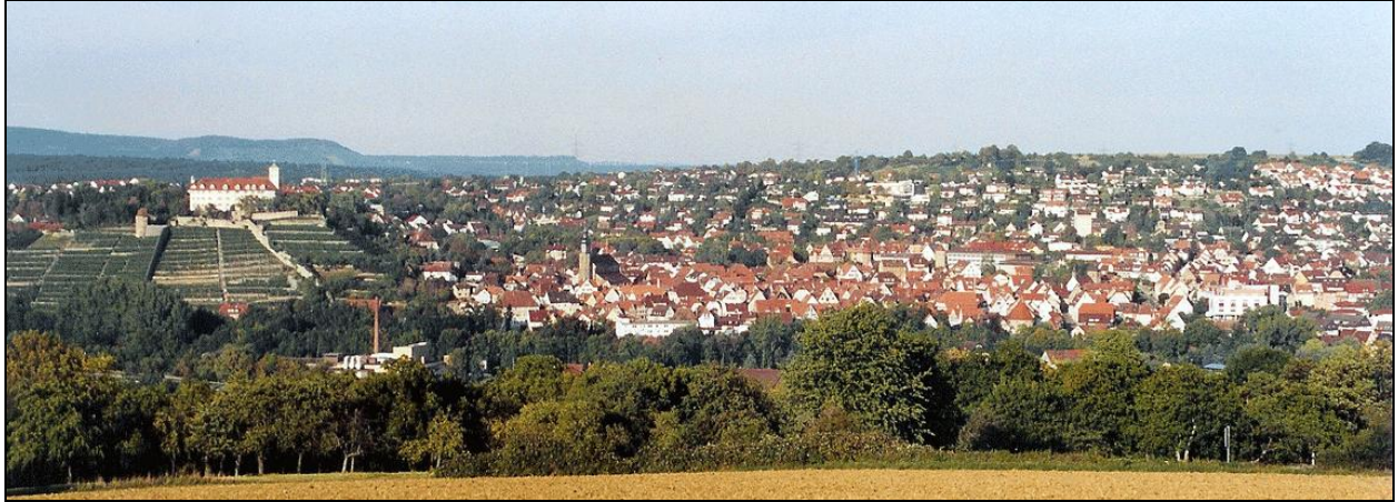
Vaihingen an der Enz mit Schloss Kallenstein

Neben den Gemeindklangkörpern, die oft gemeindeübergreifend zusammen wirken, gibt es im Kirchenbezirk einen Jugend- und den Bezirksmännerchor sowie das Bezirksorchester, das 1968 gegründet wurde.